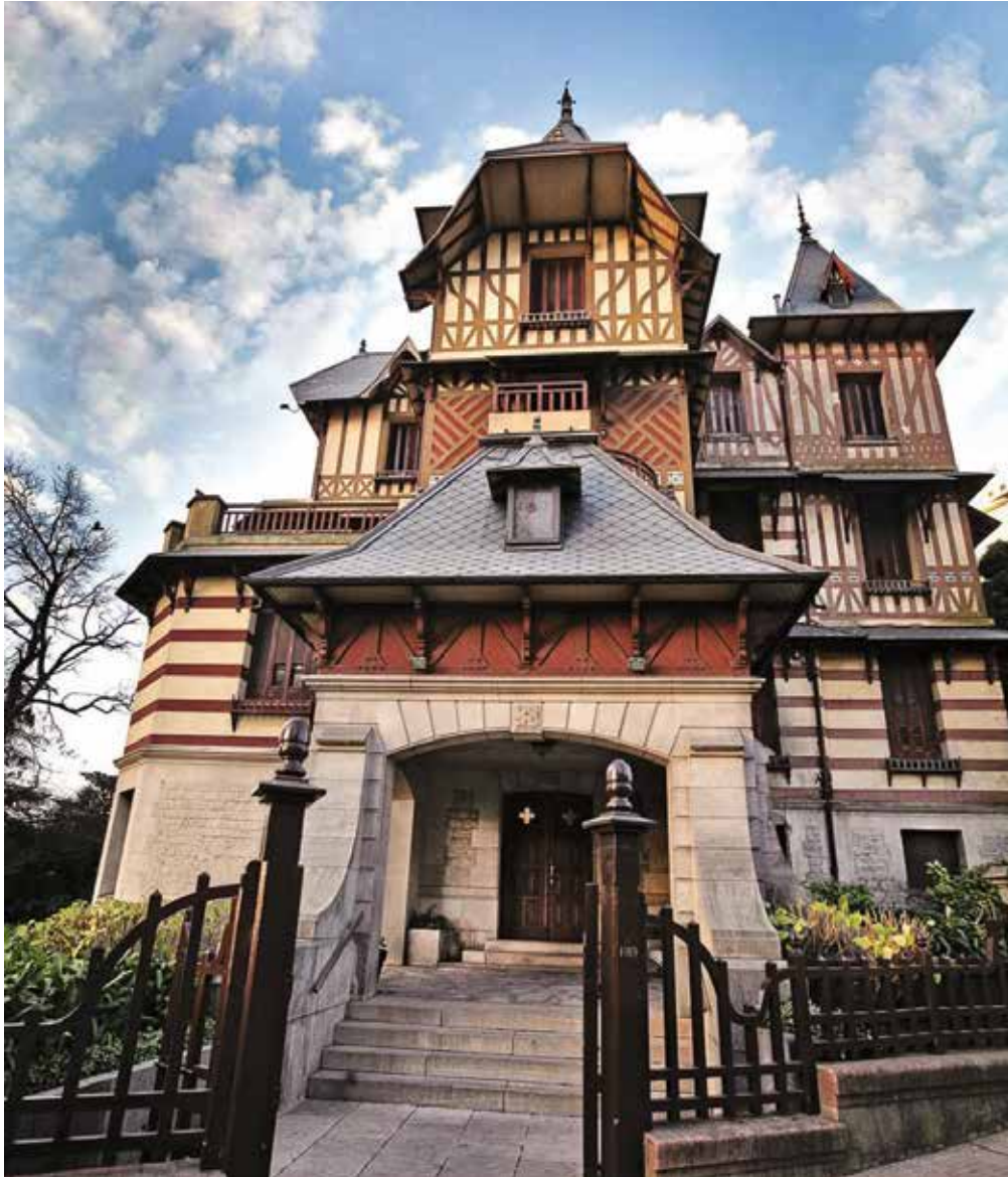
Villa Mitre (Lamadrid 3870) alberga el Museo Archivo Histórico Municipal Roberto Barili donde se exhiben fotografías, documentos, objetos y elementos relacionados con la historia marplatense. Cuenta con espacios especiales dedicados a la escritora Alfonsina Storni y al músico Astor

Piazzolla. De estilo neocolonial, la casa perteneció al ingeniero Emilio Mitre.